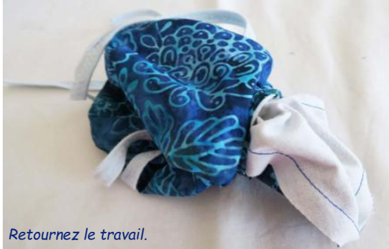
Retournez le travail.

6 - Retournez le travail par l'ouverture.