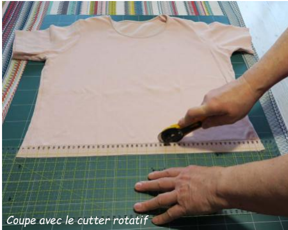
Coupe avec le cutter rotatif

Temps de réalisation : 10 mn pour 4m de cordons.