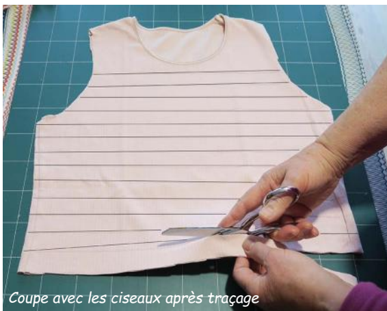
Coupe avec les ciseaux après traçage

Posez le tee-shirt à plat sur la plaque de coupe Avec la règle transparente et le cutter rotatif découpez des bandes de 3 cm dans la largeur du tee-shirt. Enlevez aux différentes bandes les coutures de côté. N'utilisez pas la 1ère bande avec l'ourlet.