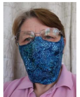
Vérifiez le réglage des cordons.

Soyez prudent, en vous protégeant Vous protégerez votre entourage !