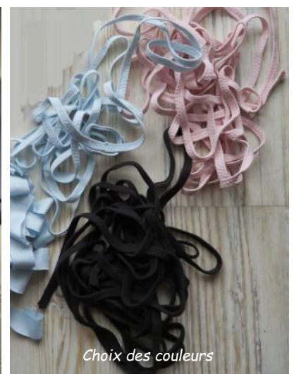
Choix des couleurs

Pliez une bande en 3 et bloquez-la sous le pied de biche. Piquez au point zigzag, largeur 4.0 longueur 3.00. Pliez au fur et à mesure de l'avancement de la