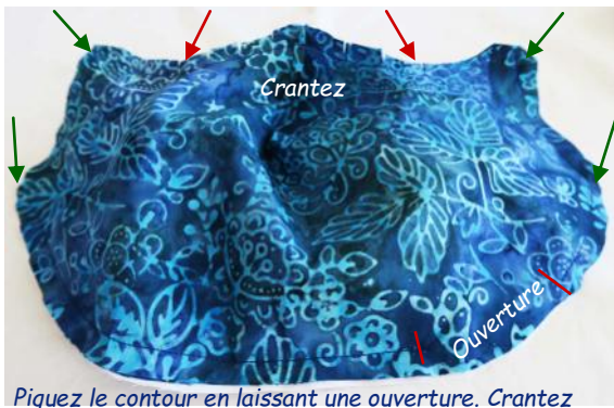
Piquez le contour en laissant une ouverture. Crantez

5 - Piquez à 8-10 mm du bord (largeur du pied de biche) tout autour en laissant une ouverture dans le bas de 6 cm environ.