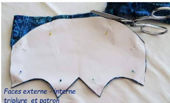
Faces externe - interne triplure et patron

1 - Pour faciliter le travail en série, il est conseillé :