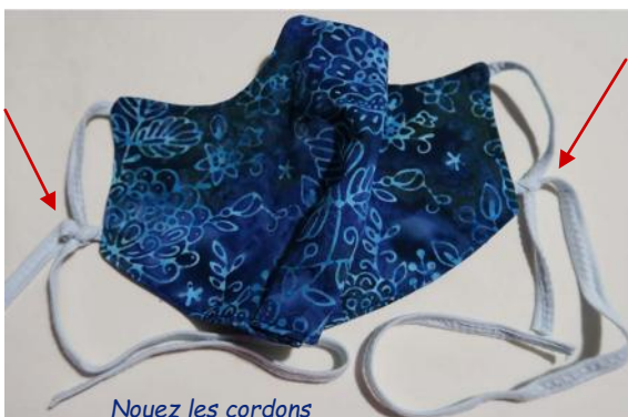
Nouez les cordons

Faites un essai : passez les cordons derrière les oreilles puis nouez les grands cordons derrière votre nuque. Ajustez les cordons si nécessaire pour avoir un port de masque confortable.