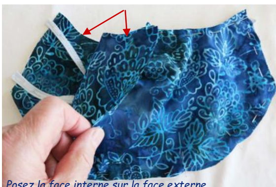
Posez la face interne sur la face externe

Conseil : laissez dépasser de 1 cm les extrémités des cordons pour faciliter la couture.