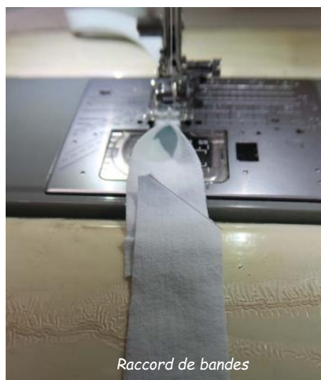
Raccord de bandes