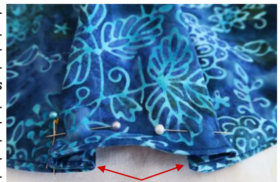
Positionnez les plis vers le milieu. Piquez

9 - De chaque côté nouez le petit cordon au grand.