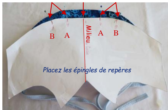
Placez les épingles de repères

8 - Pliez en 2 et placer l'épingle du milieu. Posez le milieu du patron sous cette épingle. Placez 4 épingles aux repères A et B. Formez les plis en posant A sur B, positionnez les plis vers le milieu. Epinglez puis piquez en repassant sur la surpiqure.