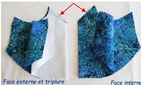
Face externe et triplure