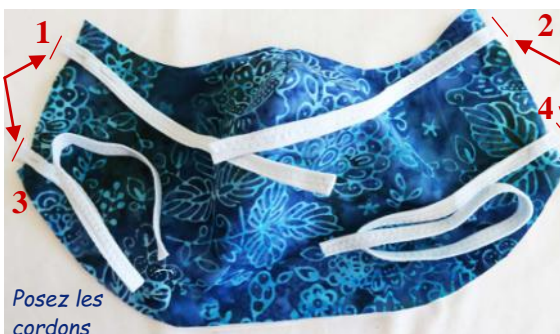
Posez les cordons

3 - Sur l'endroit de la face externe épinglez les 4 cordons :